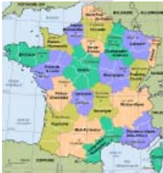
la carte de la France